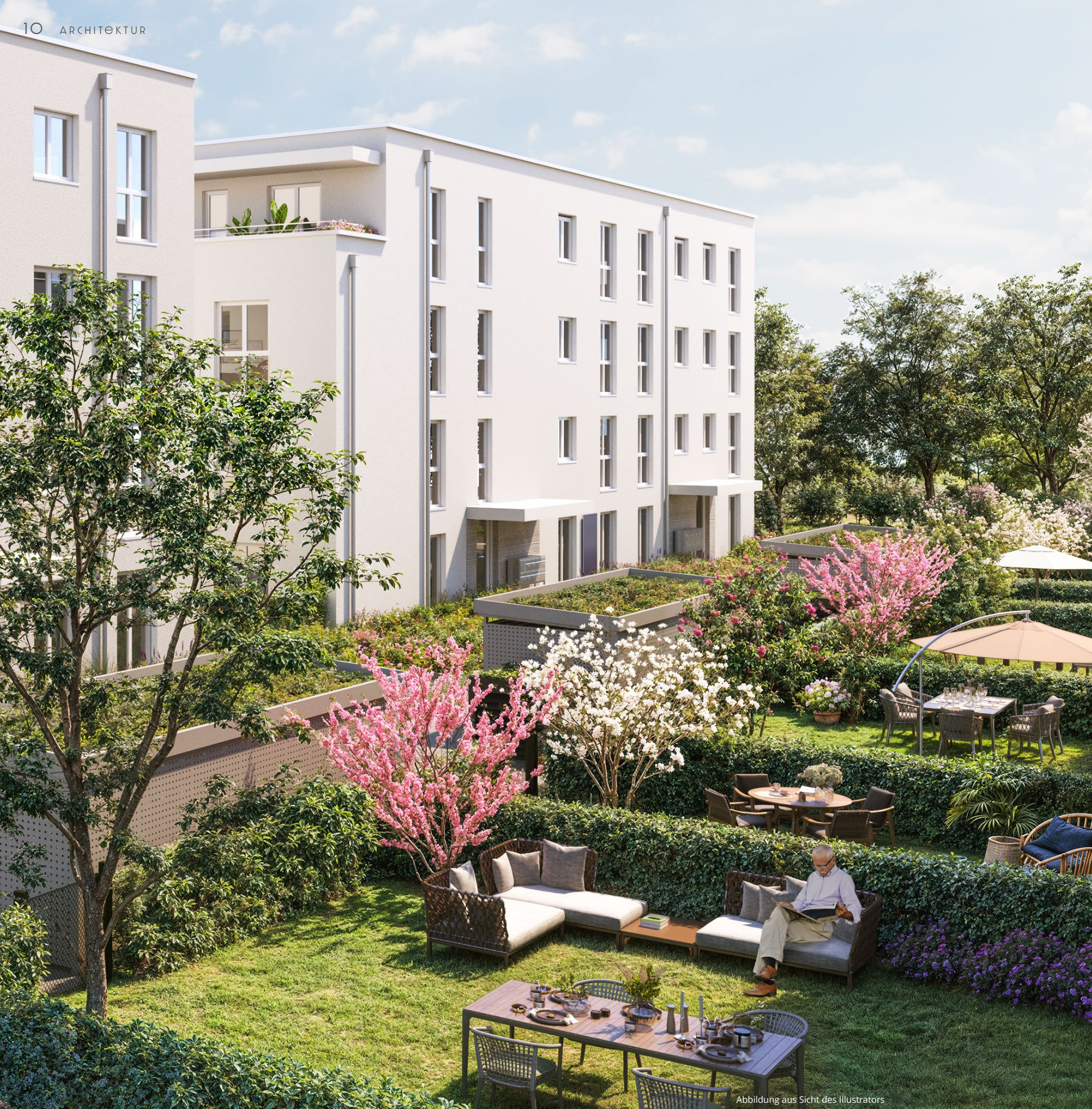
Abbildung aus Sicht des Illustrators