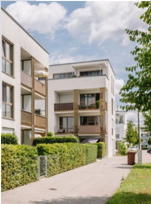
LANDSHUT, BRAUNECKWEG EIGENTUMSWOHNUNGEN