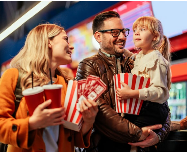
HEUTE ACTION, MORGEN FAMILIENFILM

Durchatmen, umgeben von idyllischer Natur oder historischer Kulisse. Sportlich aktiv auf Jogging- und Radwegen, im Stadion oder im Stadtbad. Durch die Altstadt schlendern, den Feierabend auf der Mühleninsel genießen oder ins Kino, Konzert oder Theater? Die Möglichkeiten, die Freizeit zu genießen und jeden Tag abwechslungsreich zu gestalten, sind grenzenlos.