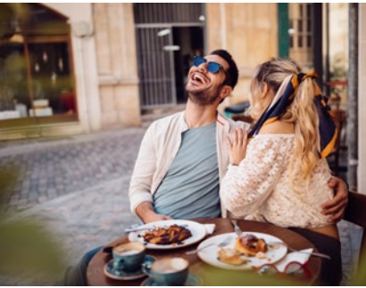
ALTER GLANZ TRIFFT MODERNES STADTLIBEN