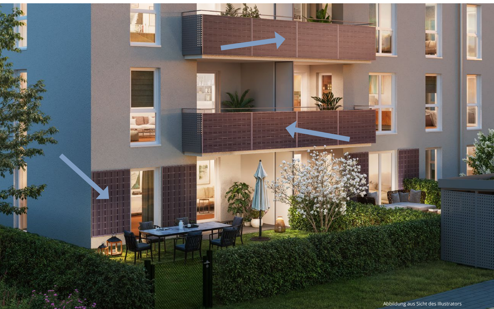
Abbildung aus Sicht des Illustrators

Freuen Sie sich auf modernes Wohnen mit besonderem Komfort, der aus dem gelungenen Zusammenspiel von innovativer Baukunst, ausgewählten Materialien und fein abgestimmten Ausstattungsdetails entspringt.