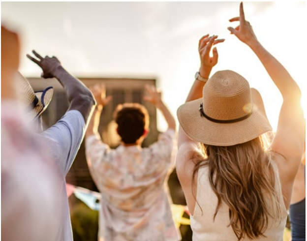
SOMMERTRADITION – KULTUR PUR UND OPEN AIR