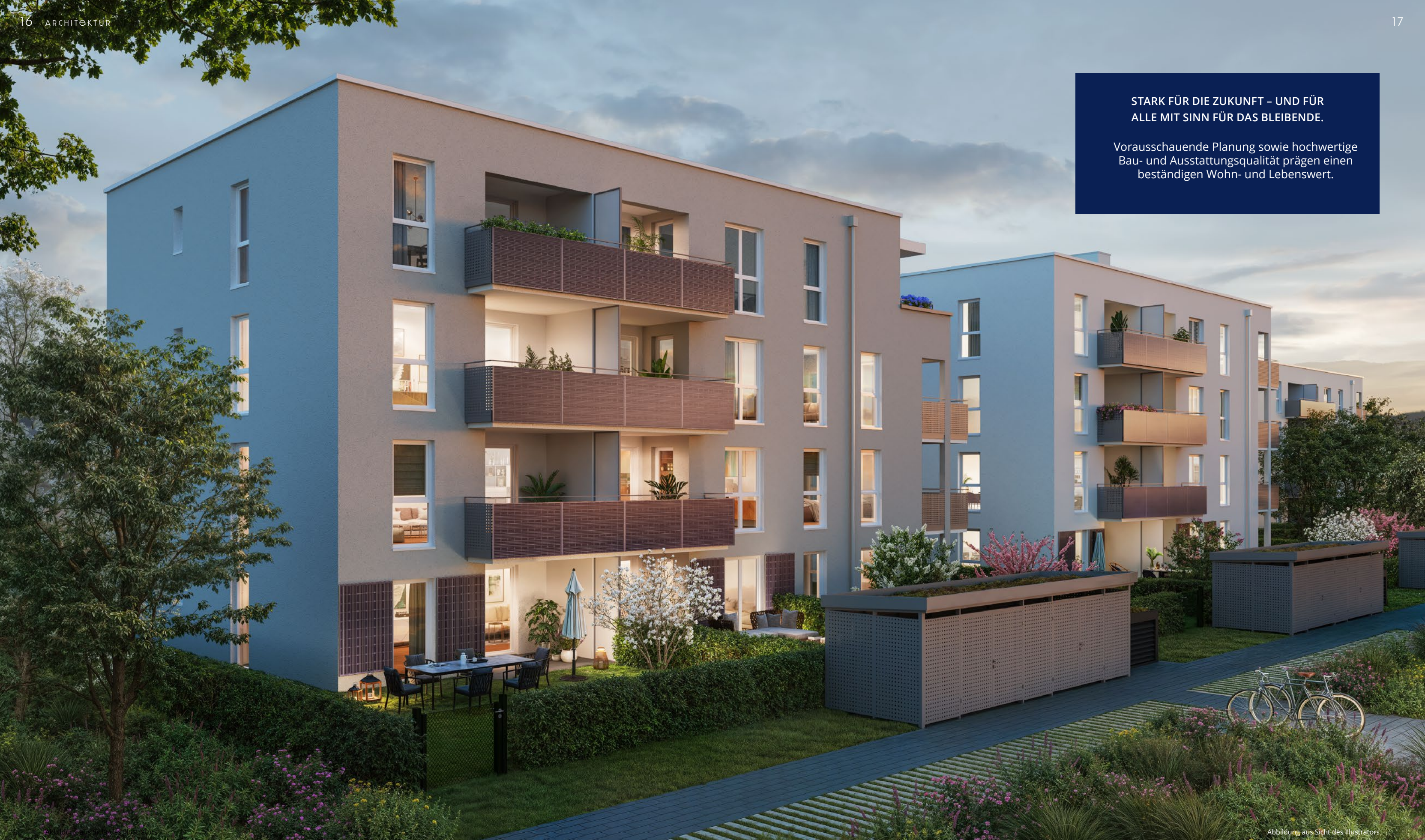
Abbildung aus Sicht des Illustrators

Vorausschauende Planung sowie hochwertige Bau- und Ausstattungsqualität prägen einen beständigen Wohn- und Lebenswert.