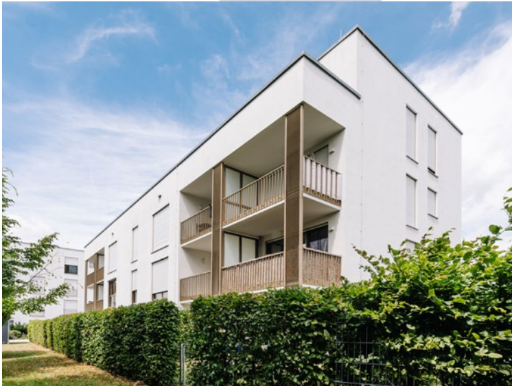
LANDSHUT, BRAUNECKWEG EIGENTUMSWOHNUNGEN