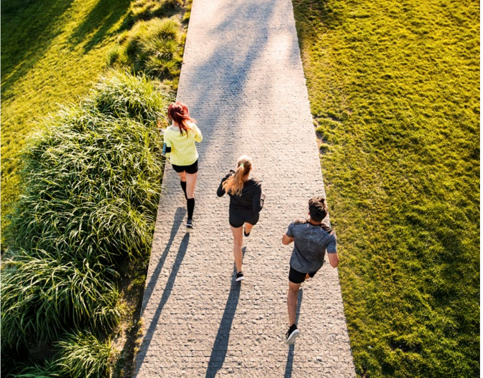
FIT BLEIBEN IM GRÜNEN