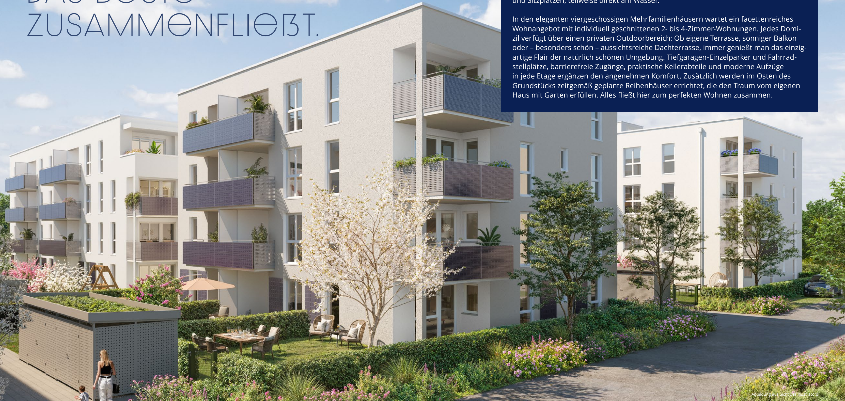
Abbildung aus Sicht des Illustrators

In den eleganten viergeschossigen Mehrfamilienhäusern wartet ein facettenreiches Wohnangebot mit individuell geschnittenen 2- bis 4-Zimmer-Wohnungen. Jedes Domizil verfügt über einen privaten Outdoorbereich: Ob eigene Terrasse, sonniger Balkon oder – besonders schön – aussichtsreiche Dachterrasse, immer genießt man das einzigartige Flair der natürlich schönen Umgebung. Tiefgaragen-Einzelparker und Fahrradstellplätze, barrierefreie Zugänge, praktische Kellerabteile und moderne Aufzüge in jede Etage ergänzen den angenehmen Komfort. Zusätzlich werden im Osten des Grundstücks zeitgemäß geplante Reihenhäuser errichtet, die den Traum vom eigenen Haus mit Garten erfüllen. Alles fließt hier zum perfekten Wohnen zusammen.