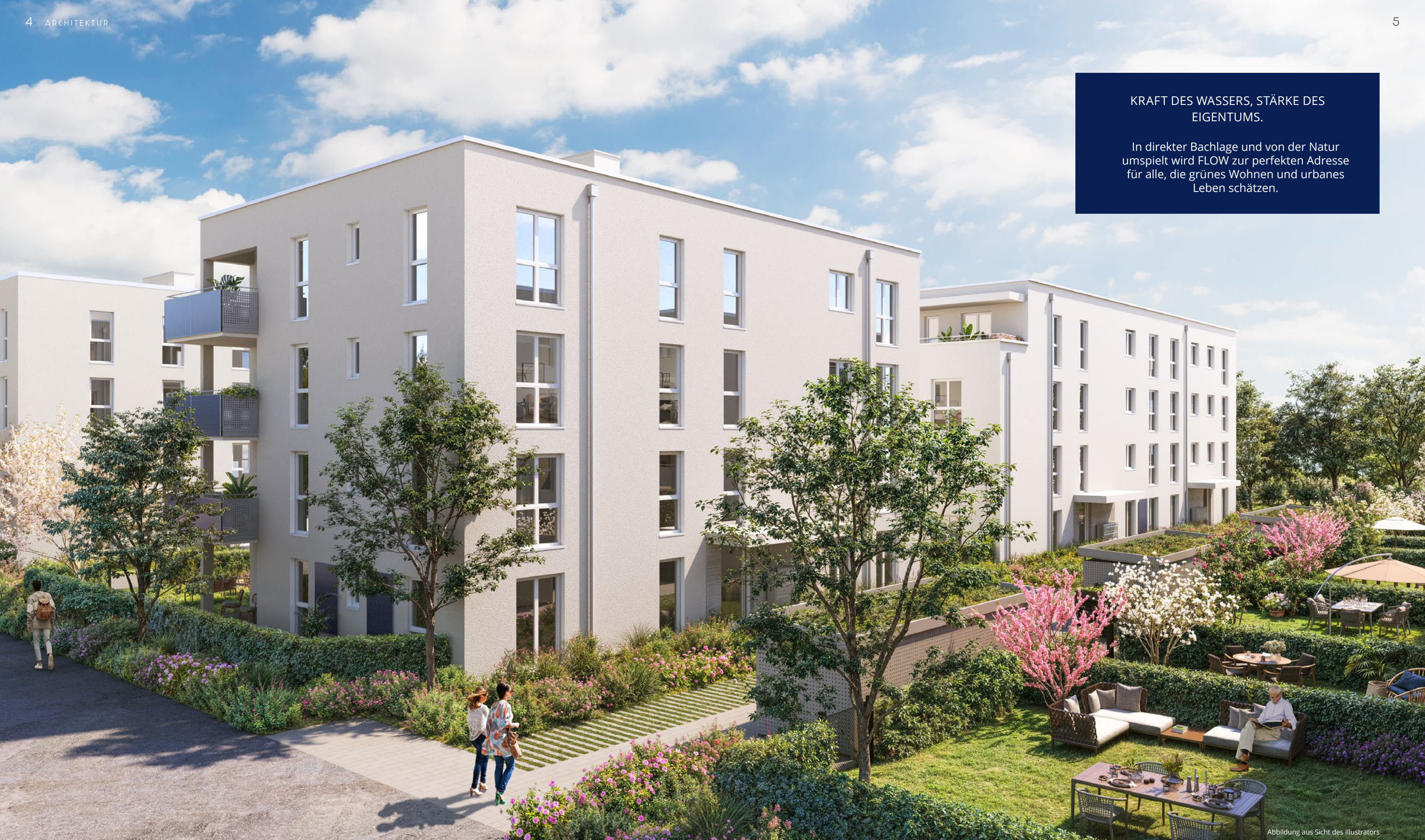
Abbildung aus Sicht des Illustrators

In direkter Bachlage und von der Natur umspielt wird FLOW zur perfekten Adresse für alle, die grünes Wohnen und urbanes Leben schätzen.