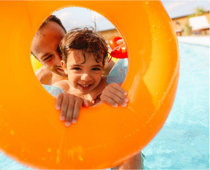
BADESPASS AN HEISSEN TAGEN