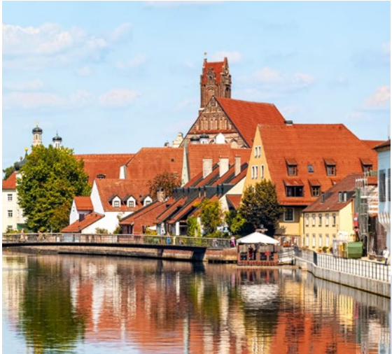
KULINARIK MIT BLICK AUFS WASSER